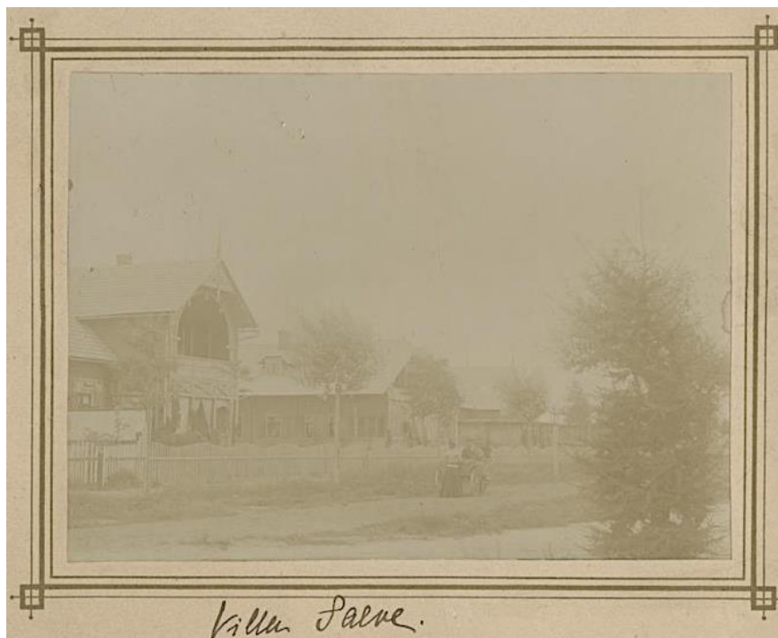
Foto 2 Vaade tänavalt 1910. a. EAA.3349.1.75.1