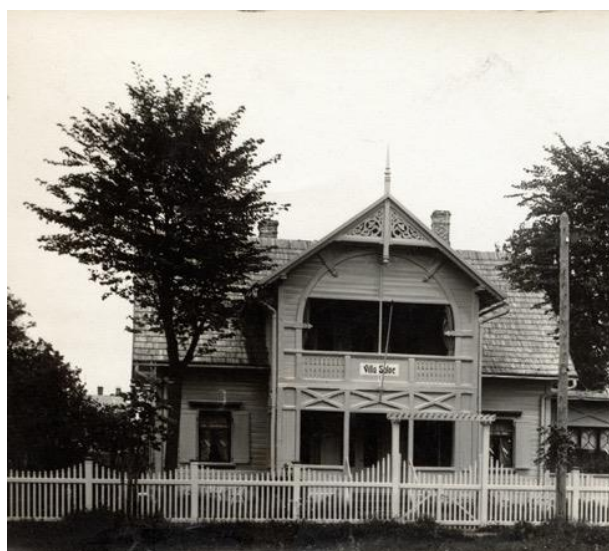
Foto 3 Vaade tänavalt 1920-ndad.