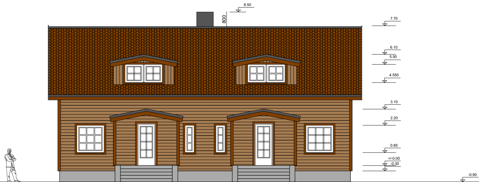
Vaade " A "