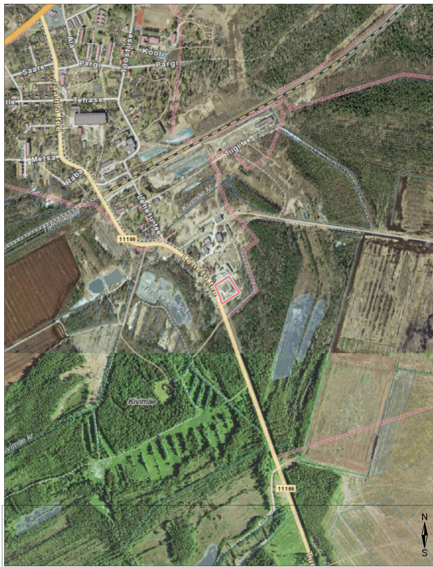
Situatsiooniskeem Möötkava 1:10 000