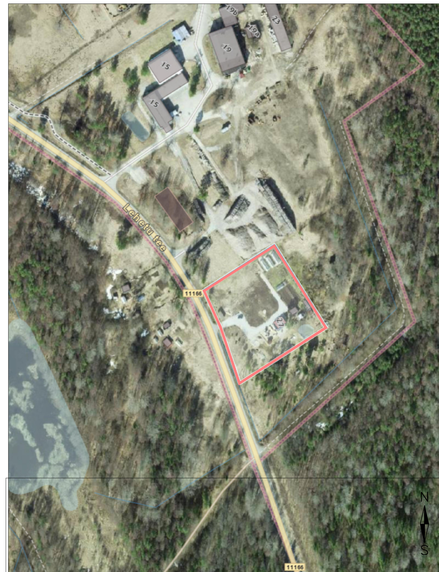
Asendiplaan Möötkava 1:2000