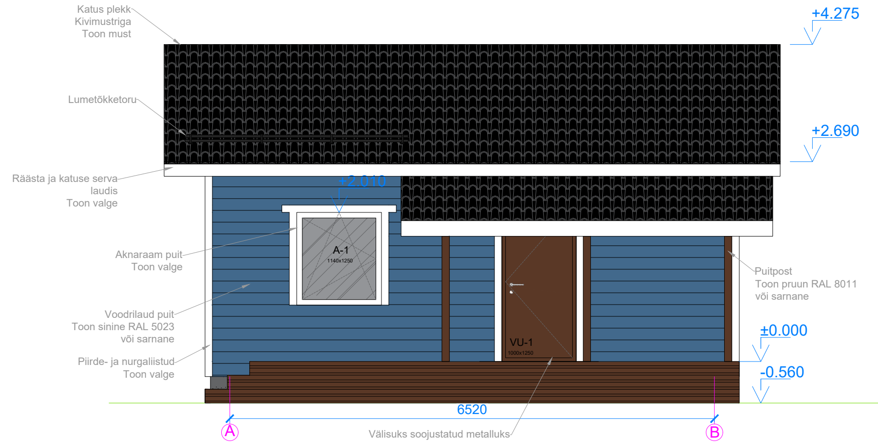
VAADE A KAGUST