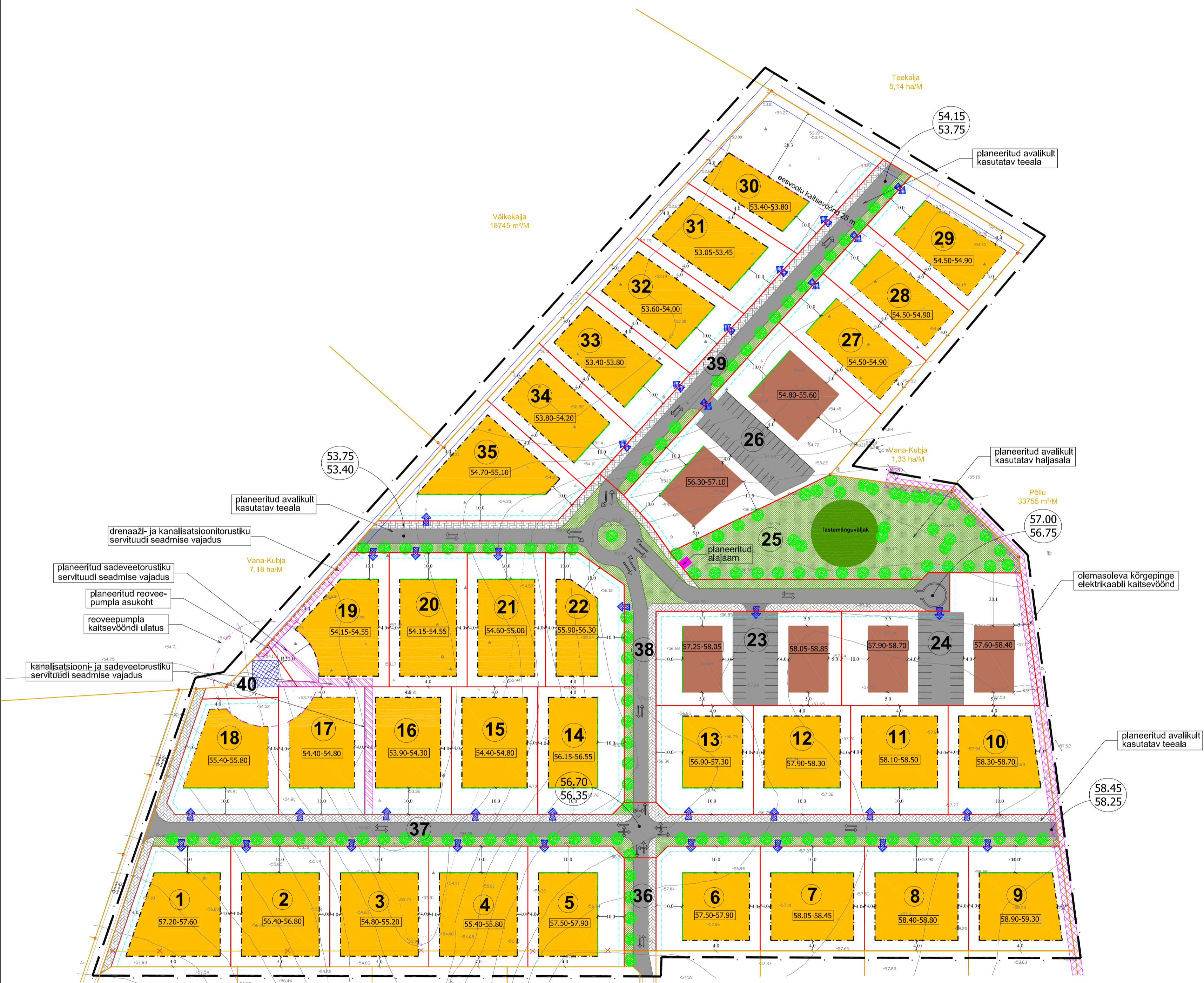
ANDMED PLANEERITAVATE KRUNDIDE KOHTA